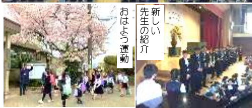
新しい先生のおはよう運動の紹介